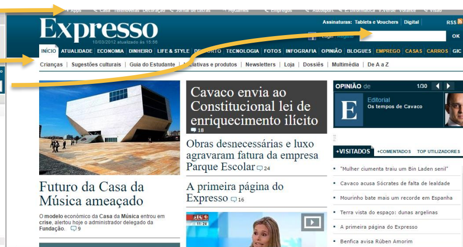
Expresso, 10-03-2012, 16:02 (em Arquivo.pt)